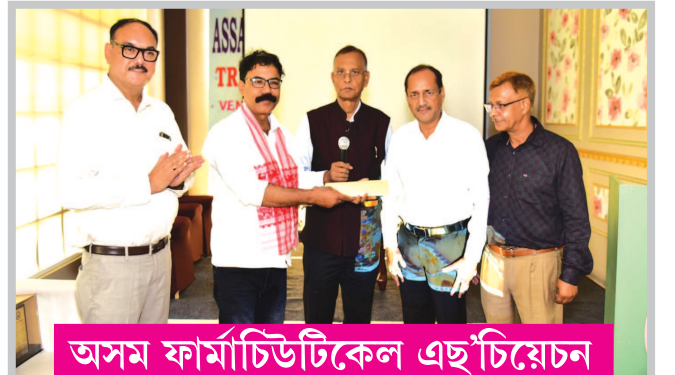
অসম ফাৰ্মাচিউটিকেল এছ'চিয়েচন