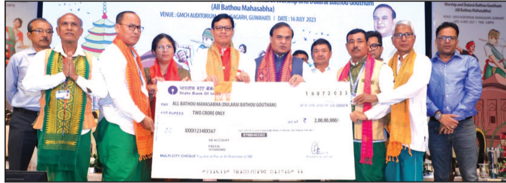
সাহায্য মঞ্জুৰি বিতৰণ কৰি মুখ্যমন্ত্ৰীৰ ঘোষণা

যদিও মুখ্যমন্ত্ৰীগৰাকীৰ শেহতীয়া দিল্লী ভ্ৰমণৰ পাছত এই চৰ্চা অমূলক বুলি পৰিগণিত হৈছে। এক সূত্ৰৰ তথ্য অনুসৰি মুখ্যমন্ত্ৰী ড॰ হিমন্ত বিশ্ব শৰ্মা আৰু বিজেপিৰ ৰাজ্যিক সভাপতি ভৱেশ কলিতাৰ নেতৃত্বতে গেৰুৱা দলটোৱে অসমত আগত লোকসভা নিৰ্বাচনত অৱতীৰ্ণ হ'ব। দলৰ হাইকমাণ্ডে গ্ৰহণ কৰিছে এই সিদ্ধান্ত। মুখ্যমন্ত্ৰী ড॰ হিমন্ত বিশ্ব শৰ্মাৰ নেতৃত্বত ৰাজ্যখনত বিভিন্ন ক্ষেত্ৰত হৈ থকা উন্নয়নমূলক কাম-কাজ, প্ৰতিশ্ৰুতি অনুসৰি ১ লাখ লোকক চৰকাৰী চাকৰি ২ পৃষ্ঠাত